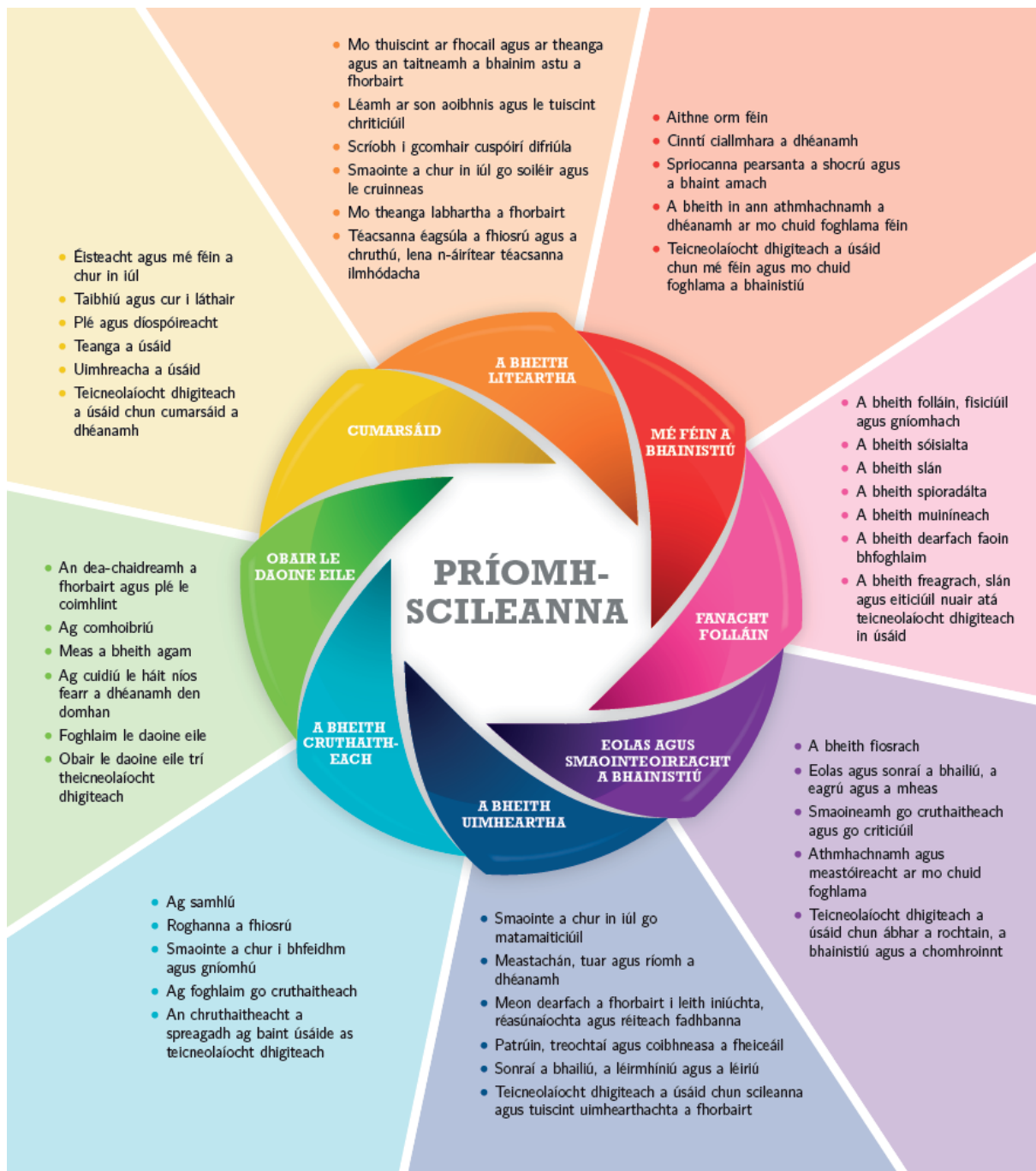
Fíor 1: Príomhscileanna na Sraithe Sóisearaí