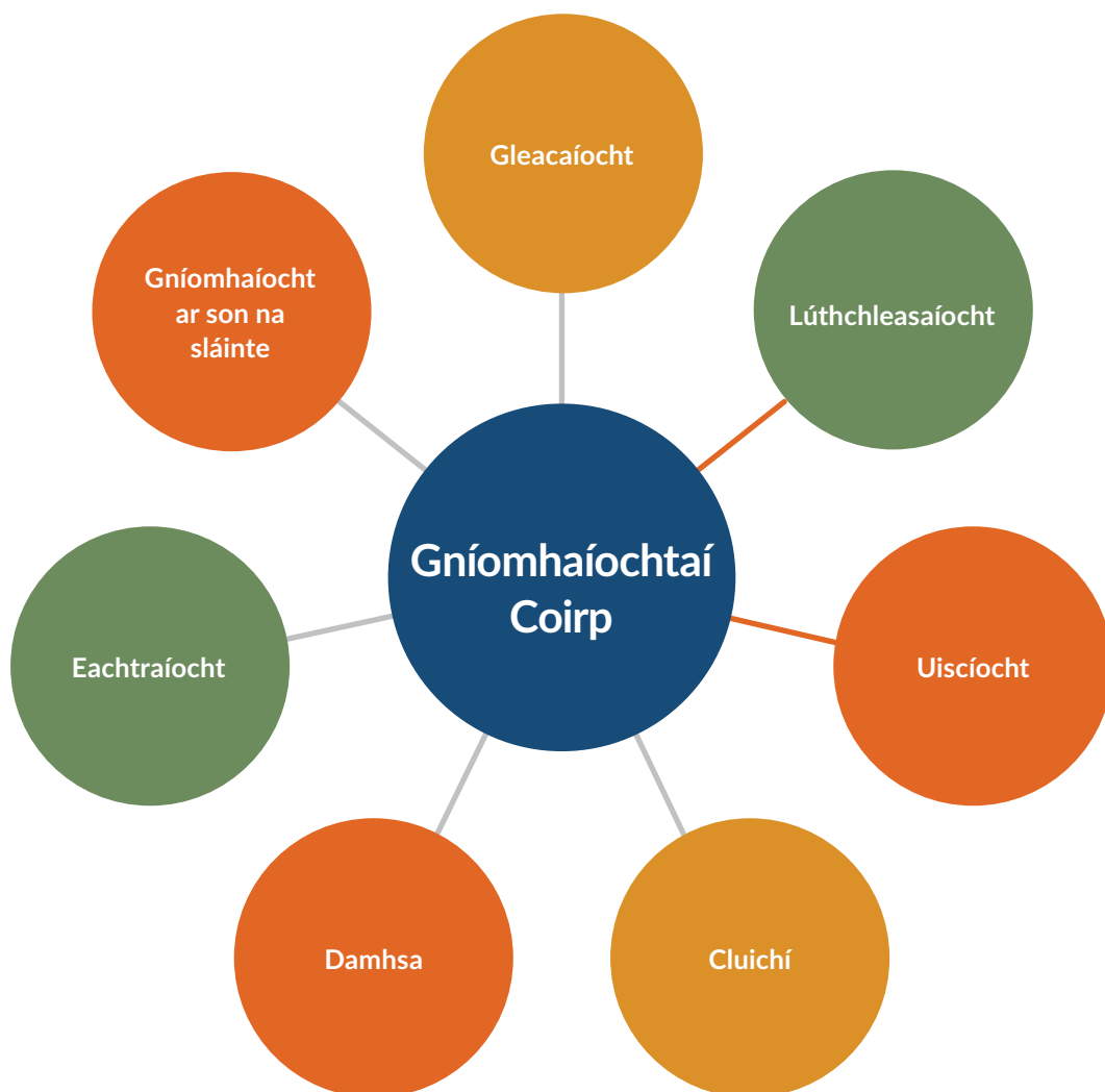
Fíor 4 Réimsí gníomhaíochta coirp

Áirítear seacht réimse gníomhaíochta coirp sa tsonraíocht seo a léiríonn raon de chatagóirí gníomhaíochta coirp éagsúla. Tá tréithe ar leith ag gach ceann acu agus cuireann siad le gnóthachtáil mhóraidhm an Chorpoideachais. Tá na gníomhaíochtaí coirp mar mheán lárnach don scoláire agus é nó í ag baint amach na dtorthaí foghlama.