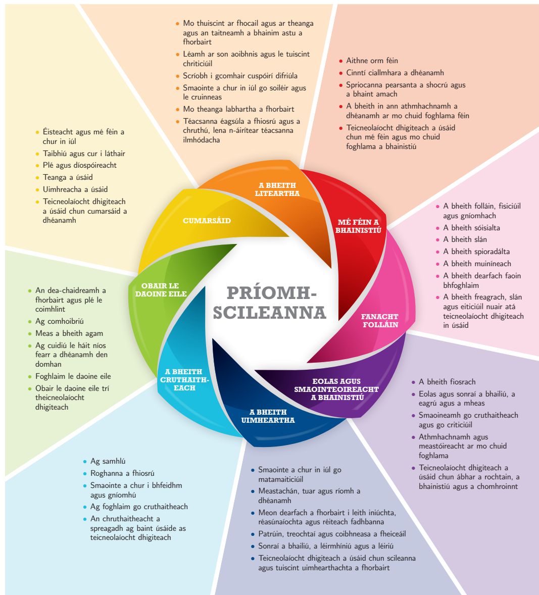
Fíor 1 Príomhscileanna na Sraithe Sóisearaí

I dteannta a n-inneachair agus a n-eolais shonraigh, tugann ábhair agus gearrchúrsaí na sraithe sóisearaí deiseanna don scoláire chun réimse leathan príomhscileanna a fhorbairt. Tá deiseanna ann chun tacú leis na príomhscileanna uile sa chúrsa seo ach tá roinnt díobh a bhfuil tábhacht ar leith leo. Saináithnítear sna samplaí thíos roinnt de na gnéithe a bhaineann le gníomhaíochtaí foghlama sa Chorpoidéachas. Chomh maith leis sin, is féidir leis an múinteoir a lán de na gnéithe eile de phríomhscileanna ar leith a fhí isteach ina chuid pleanála don seomra ranga. Leagtar amach na hocht bpríomhscil go mion i bPríomhscileanna na Sraithe Sóisearaí.