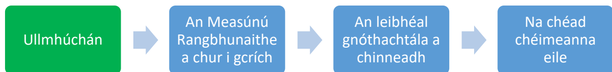
Fíor 2 An próiseas le Measúnuithe Rangbhunaithe a dhéanamh

phróisis seo treoir a thabhairt don mhúinteoir de réir mar a thacaíonn sé lena scoláire Measúnú Rangbhunaithe 2 a chur i gcrích.